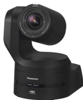
NEU – AW-UE160