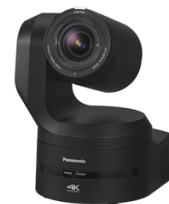
NEU – AW-UE160

Das kostengünstige LIVE-TV oder Streaming Setup für